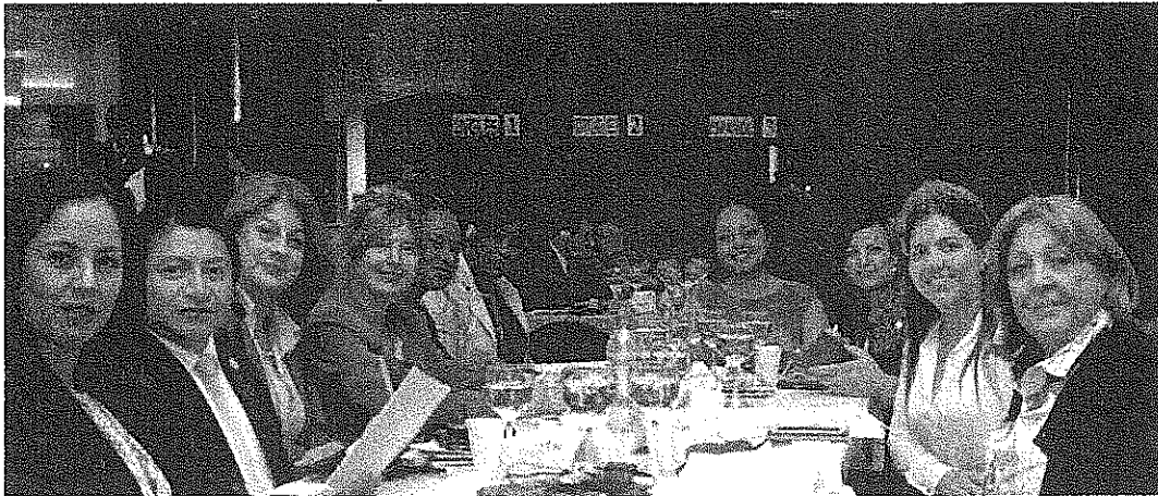
Dip. Fed. Karina Padilla Ávila

1 ParlAmericas es la red de legislaturas nacionales de los estados miembros de la Organización de los Estados Americanos (OEA). Funciona como un foro independiente para las y los parlamentarios de las Américas y el Caribe comprometidos con el diálogo político cooperativo y con la participación en el sistema interamericano.